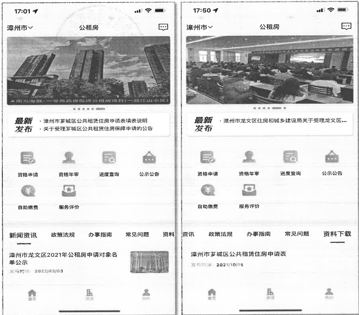
▲图为公租房 APP 界面

公租房 APP 具有政策信息浏览、房源信息查看、在线资格申请、自助缴费和服务评价五大功能。下面就跟小编来看看具体怎么操作吧！首先扫描二维码下载安装公租房 APP。